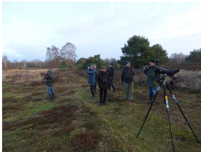
Op zoek naar de Klapekster in Punthuizen

Waarneming.nl is in november 2007 een landelijke klapekstertelling gestart om de verblijfplaatsen en de overwinterende aantallen goed in beeld te krijgen. Daartoe werden vogelaars en vogelwerkgroepen opgeroepen om potentiële overwinteringsplaatsen van Klapeksters tijdens twee telweekenden in hun omgeving te bezoeken om Klapeksters op te sporen. Onze vogelwerkgroep heeft daar ook sinds 2007 medewerking aan verleend. Tegenwoordig wordt deze telling in een samenwerking tussen waarneming.nl en Sovon georganiseerd. De potentiële klapekstergebieden die in Losser worden onderzocht zijn: Oelemars, Omleidingskanaal/Lutterzand, Punthuizen, Beuninger Achterveld, Strengveldweg, Zwartkampsweg en Stroothuizen. Het merendeel van de gebieden wordt beheerd door SBB.