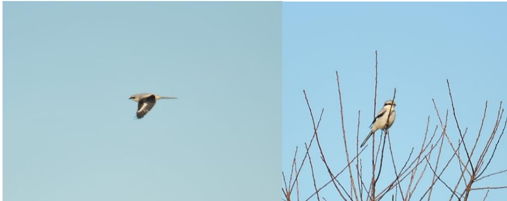
Klapekster Beuninger Achterveld

De tweede telling vond plaats op vrijdagmorgen 19 februari 2016. Het was wat grijsig weer, met af en toe een licht spatje motregen, maar later op de ochtend werd het wel droog. De Klapekster die bij de eerste telling in het Beuninger Achterveld werd gezien, zat nu weer ongeveer op dezelfde plek.