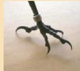
Een aluminium vogelring: zo licht als een veertje.

Zilvermeeuw: Gemiddelde levensduur 4 jaar Oudste terugmelding 32 jaar en 1 maand Merel: Gemiddelde levensduur 1,3 jaar Oudste terugmelding 16 jaar en 9 maanden