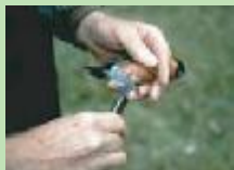
Met een speciale tang kun je de ring rondom de poot van een vogel aanbrengen.

In Nederland gebruiken alle ringers ringen met 'Vogeltrekstation Arnhem Holland' erop. Op de kleinste ringen past alleen maar 'Arnhem VT Holland'. Op elke ring staat een uniek nummer. Zo kun je precies terugzoeken om welk individu het gaat.