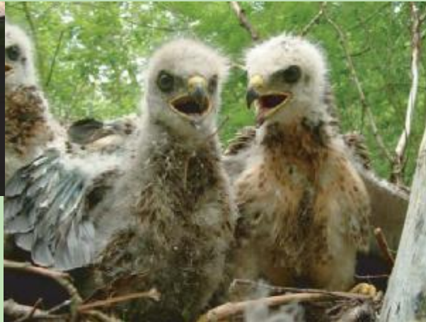
Bulzerdjongen kun je in het nest ringen. Volwassen vogels moet je vangen.