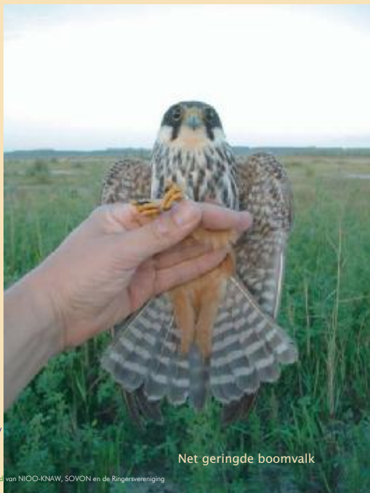
Net geringde boomvalk

In 1911 werd in Nederland de eerste vogelring 'aangelegd'. De coördinatie lag bij het Rijksmuseum voor Natuurlijke Historie in Leiden. In 1931 ontstond de Stichting Vogeltrekstation Texel, die – zonder 'Texel' in de naam – nog steeds bestaat. Vanaf 1954 nam de voorloper van het Nederlands Instituut voor Ecologie (NIOO-KNAW) steeds meer taken over in het onderzoek en de administratie. Het instituut was toen nog niet in Heteren maar in Arnhem gevestigd; hier herinnert de naam 'Vogeltrekstation Arnhem' nog aan. Dat staat sinds 1963 op de ringen, en dat blijft er ook op staan voor de noodzakelijke continuïteit. Sinds 2006 is het Vogeltrekstation een samenwerkingsverband van NIOO-KNAW, SOVON en de Ringersvereniging, en heten we Vogeltrekstation – Centrum voor vogeltrek en –demografie.