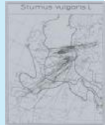
Trekbewegingen van de spreeuw.

De Europese commissie vroeg bij EURING voor allerlei soorten trekvogels na wat de effecten van jacht in Europa en Noord-Afrika zijn. Het aantal 'jachtslachtoffers' blijkt af te nemen, maar voor bepaalde soorten teknen zich duidelijk 'hot spots' met hoge jachtdruk af.