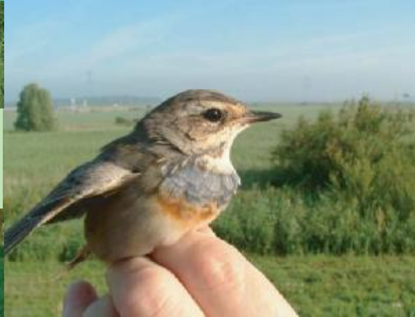
Ringers zien van alles langskomen: vlaamse gaai, vuurgoudhaan en blauwborst bijvoorbeeld.