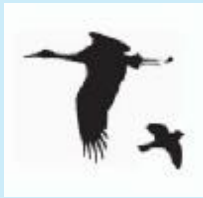
Vogels teruggezien: 1% van de geringde, kleine mussen 50% van de geringde, grote ooievaars

Het draait allemaal om de 'terugmeldingen': een geringde vogel is ergens gezien, gevangen of dood gevonden. Dat kan al een dag later zijn en heel dichtbij, maar ook vele jaren of duizenden kilometers verderop. Recordhouder van de terugmeldingen is een kokmeeuw, geringd op 20 oktober 1997. Maar liefst 679 keer zagen vogelaars dit dier. Alleen al voor Nederland gaat het per jaar om 65.000 terugmeldingen van geringde vogels.